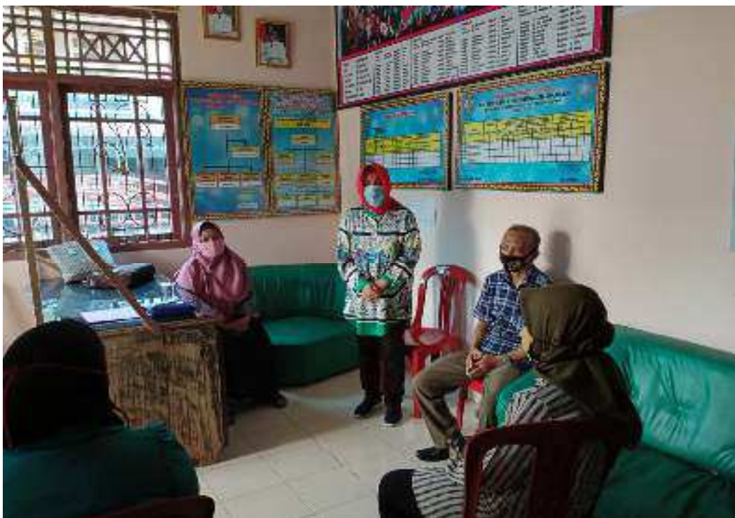
Anggota Tim PKM sedang memberikan Materi