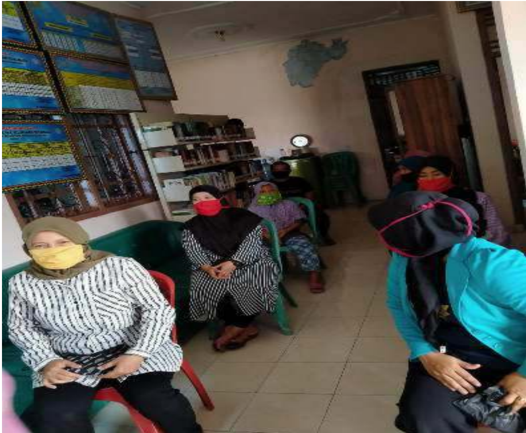
Ibu-ibu Kelompok Pengrajin Emping sedang mengikuti Penyuluhan