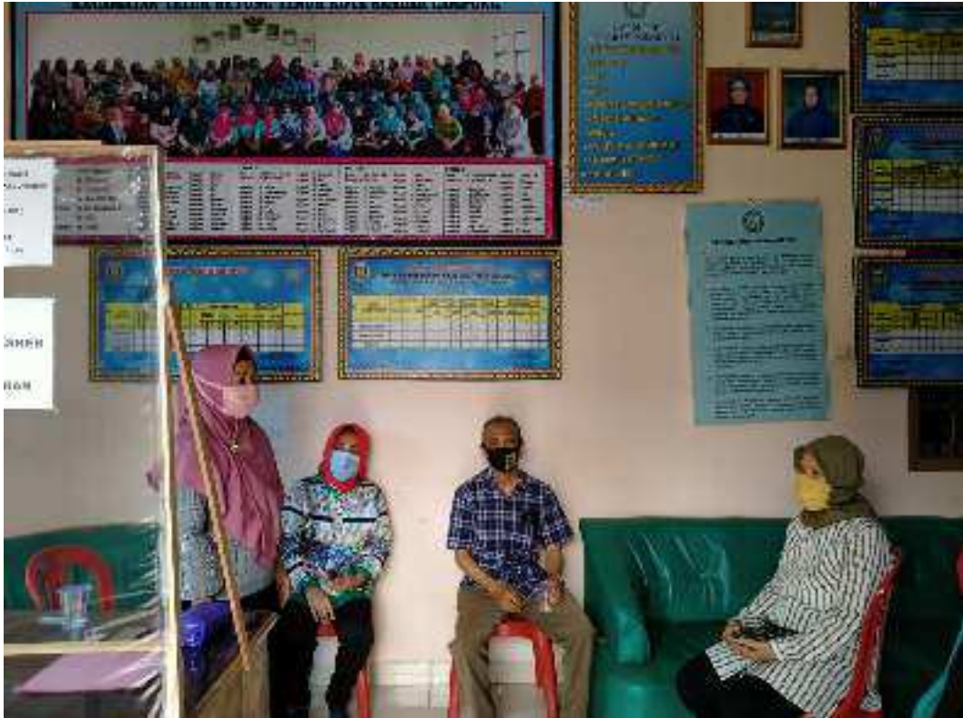
Ibu Ketua Tim PKM sedang memberikan Sambutan