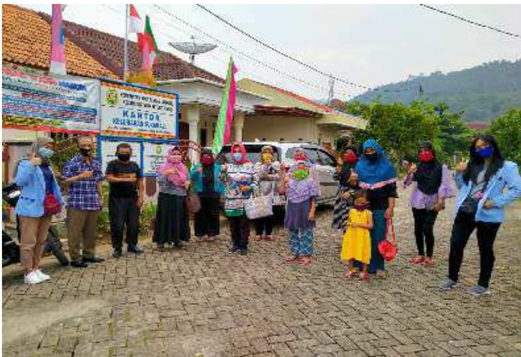
Tim PKM dan Ibu-ibu Kelompok Pengrajin Emping di depan Kantor Kelurahan Sukamaju.